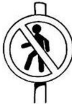
Proibido trânsito de pedestre