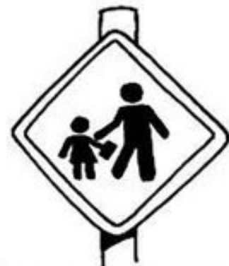
Área escolar próxima

✎ Pinte o semáforo para carros nas cores indicadas e ligue corretamente: