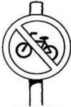
Proibido trânsito de bicicleta

Servem para orientar os motoristas e os pedestres.